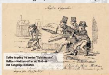
Satire tegning fra avisen "Spionens" Moltzen-Moltzen-affæren, 1864-66 Det Kongelige Bibliotek

de i sagen med den preussiske spion, blev aldrig åbenbar. Episoden blev offentlig kendt, da avisen "Fædrelandet" afslørede sagerne i den såkaldte Moltzen affære d. 7. marts 1866, med en række satiretegninger om spionen