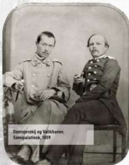
Dostojevskij og Valikhanov, Semipalatinsk, 1859

ved Stillehavet, hvor man grundlagde byen Vladivostok i 1860. Traktaten og forholdene for folkene i Amur-området blev også beskrevet i danske aviser. Den diplomatiske aftale var en udløber af Opiumskrigen 1856-60. Wrangel havde desuden undervejs indsamlet og katalogiseret naturvidenskabelige prøver på den lange rejse, der blev foretaget med den kejserlige russiske marine i årene 1858 - 59.