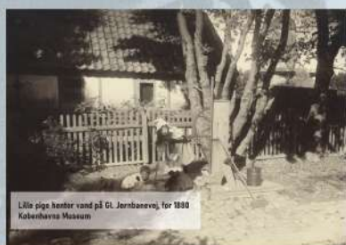
Lille pige henter vand på St. Jernbanevej, for 1868 København Museum